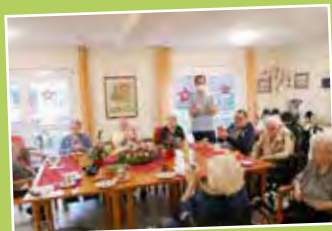
Adventkaffee in der Wohnküche