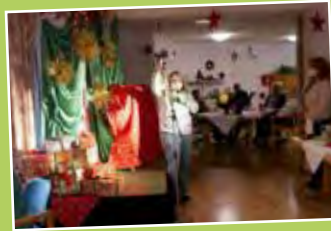
Weihnachtsstimmung in der Gruppe