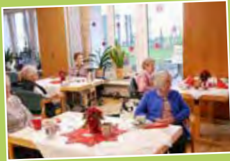
Weihnachtsstimmung in der Gruppe